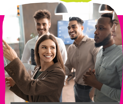
DYNAMIQUE DE GROUPE ET EFFICACITÉ DES RÉUNIONS

! Chaque apprenant repart avec son profil de personnalité PCM