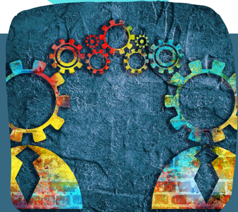
INDIVIDUALISATION DE LA RELATION

! Chaque apprenant repart avec son profil de personnalité PCM