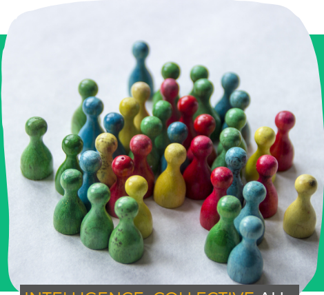
INTELLIGENCE COLLECTIVE AU SERVICE DE LA COHÉSION

! Chaque apprenant repart avec son profil de personnalité PCM